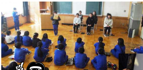
緊張感いっぱいの 演説会場

任期満了に伴う児童会会長選挙(15日告示、27日投票)は、無所属新人3氏が立候補し、三つどもえの選挙戦が繰り広げられました。朝や休み時間の街頭演説や個人演説会など、5日間の選挙戦を戦い抜いた候補者たちは、27日の立会演説会で、集まった有権者に対し、これまでの訴えの集大成として、支持を力強く呼びかけました。 二人一人の絆が深い学校を目指し、助け合い週間を創設する、「みんなの笑顔があふれる、明るく楽しい学校づくりのため、あいさつ週間に取り組む」、「全校が元気で楽しく生活を送れる学校を目指し、全校で遊ぶ機会を増やす」など、三者三様の公約を訴えまし